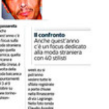
Il confronto Anche quest'anno c'è un focus dedicato alla moda straniera con 40 stilisti